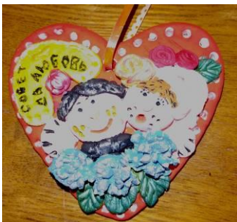
Работа выполнена из соленого теста.

Аню Сидорову, ученицу 1 класса, занявшую 3 место в районном конкурсе творческих работ «От сердца к сердцу».