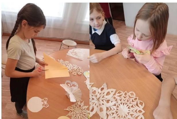
Мастерская Деда Мороза.