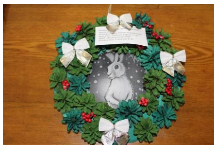
Несколько работ наших учеников были

представлены на муниципальном конкурсе «Новогодние поделки» .