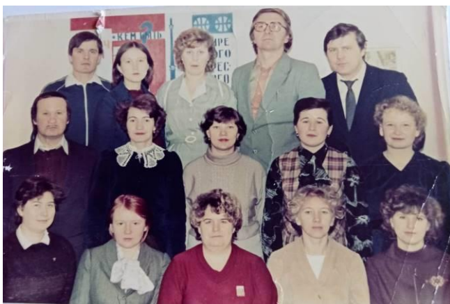
Педагоги Редкодубской средней школы, 1987 г.

Учитель играет огромную роль в жизни любого человека. Это тот, кто дает нам не только знания, но и показывает мир с другой