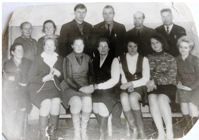
Коллектив Турдаковской восьмилетней школы.

После службы в армии в 1971 году был назначен учителем труда в Турдаковскую восьмилетнюю школу.