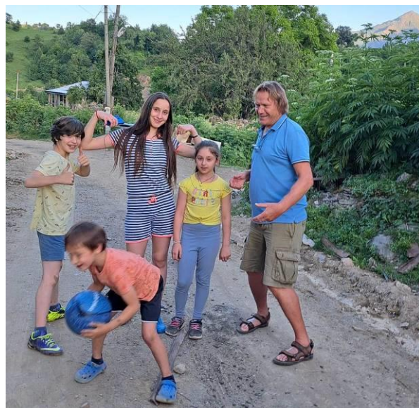
Случайная встреча с грузинскими детьми.

В конце хочу пожелать молодым читателям - моим землякам смело преследовать свои мечты и почаще подниматься на такие земные высоты! Успешных вам путей-дорог, друзья-товарищи!