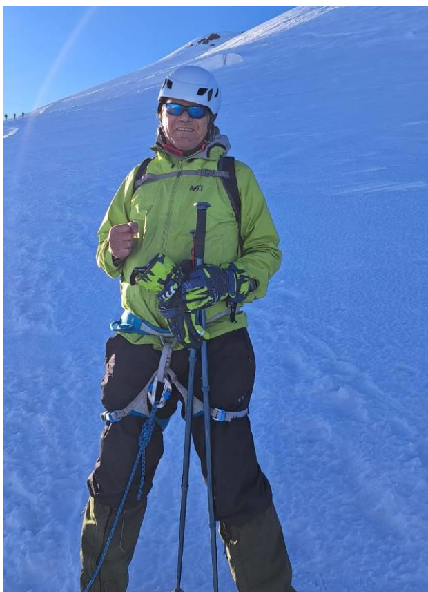
Вершина Казбека за спиной.

4500 м. Поднялись на Казбекское плато. Здесь обыкновенно участники отдыхают и атакуют последние 500 м. Тронулись вверх, и тут я понял, что дальше я не могу идти - нехватка кислорода. Как проявляется этот дефицит? - головокружение, тошнота, мышцы ослабевают, а это значит, что дальше идти - большой риск для здоровья. После короткого совещания меня возвращают с группой туристов в базовой лагерь.