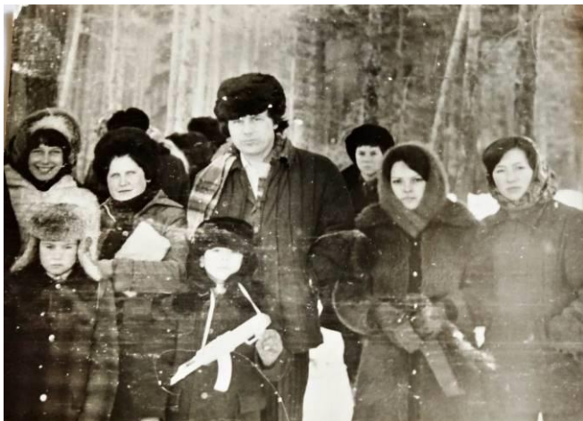
Первые годы работы в Редкодубской средней школе. «Зарница».