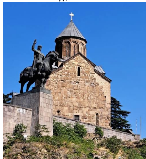
Древнейший храм Метехи над Курой в Тбилиси.