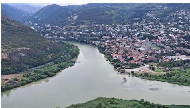
Слияние Арагвы и Куры.

По прибытии в Степанцминды (Святой Степан), с балкона гостевого дома мы увидели позолоченную закатным заревом заветную вершину Казбек.