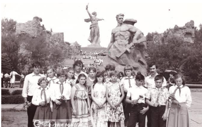
Волгоград, на Мамаевом кургане 1982 г.