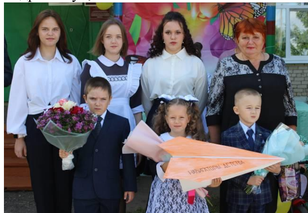
Первый раз в первый класс с «Самолетиком будущего»!

День знаний – это очень символический праздник. Начинается учебный год, а вместе с ним начинается новая ступень в жизни каждого ученика. И все мы говорим: «Здравствуй, школа!»