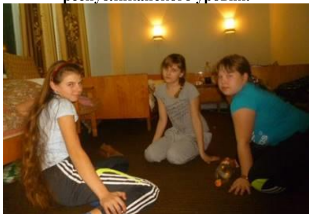
Пятиклассницы 2013 года в гостинице «Венец» во время соревнований по мини-футболу Приволжского федерального округа.