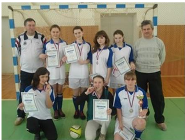
Победители соревнований республиканского уровня.