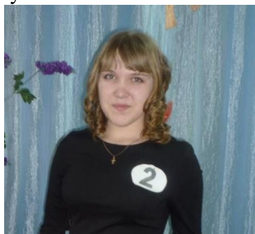
Активная участница всех мероприятий в школе (Фото 2016г. из архива газеты).