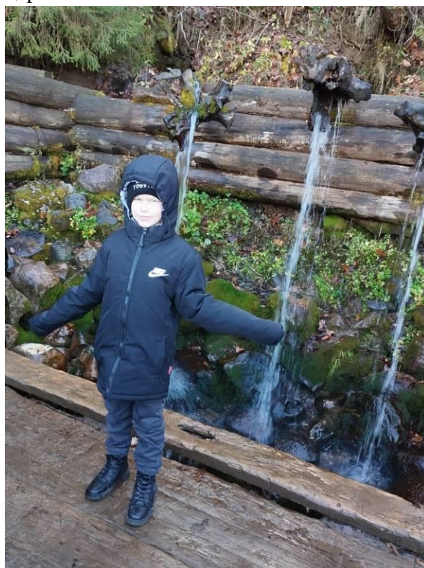
Около святых источников.

А ещё мы ездили по святым местам. Гремячий Ключ - это святой источник, основан Сергеем Радонежским, я пил там святую воду. Там очень много купелей. Вокруг старинные деревянные часовенки и церкви.