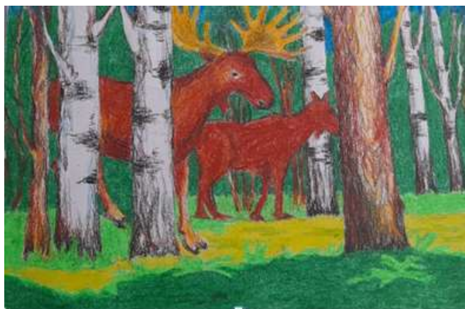
Рис. Н. Григичевой.

Мы живем рядом с лесом. Иногда прямо в окно можно увидеть, как пробегает косуля, как лакомятся лоси около стога сена, как кабаны воруют картошку. Частенько охотится за курочками лиса, в небе парят ястребы, белки прыгают на елях.