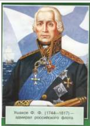
Ушаков Ф. Ф. [1744–1817] — адмирал российского флота.

15 октября отмечался День памяти прославленного русского флотоводца, Федора Федоровича Ушакова, причисленного к лику святых.