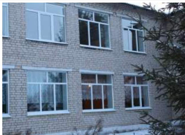
Наши новенькие окна.

Уходящий год для нашей школы знаменателен не только успехами в творческих конкурсах и олимпиадах, но и заменой старых окон на новые. Все долго ждали этого события, и очень ему рады.