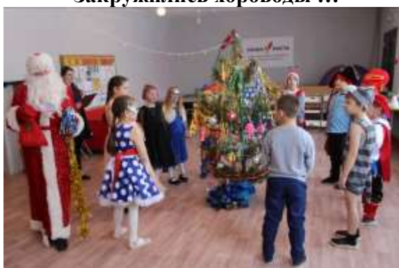
Ожили сказочные герои...