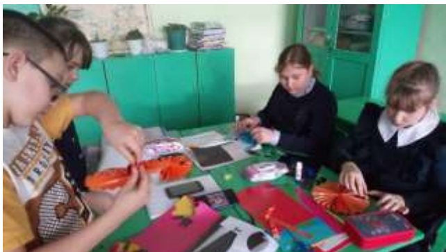
Четвероклассники мастерят символов Нового 2022 года.

В течение нескольких предновогодних недель в школе работала "Мастерская Деда Мороза".