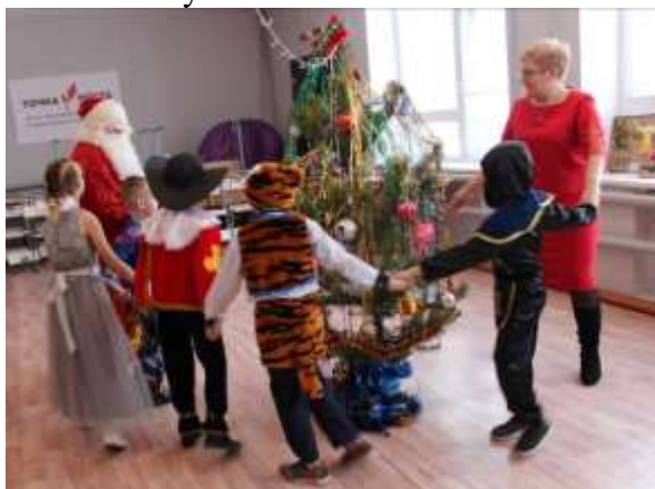
Закружились хороводы ...

Уже второй год нам приходится жить в условиях коронавирусной пандемии. Новогодние праздники каждый класс проводит самостоятельно. Но Дед Мороз все-таки заглянул на каждую елочку и принёс с собой сказку.