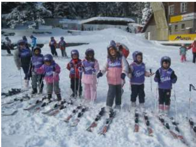
Лыжи с раннего возраста.