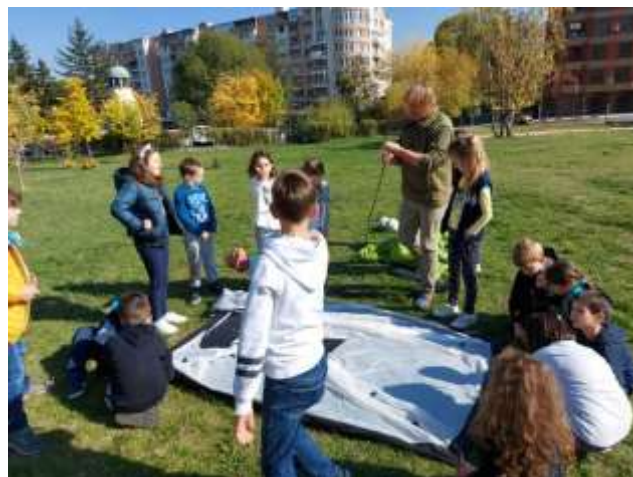
Учимся ставить палатку.