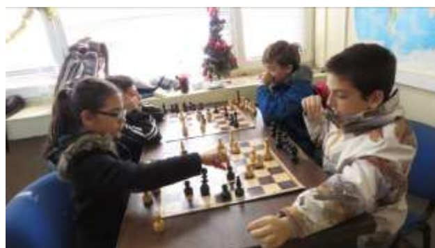
Игра в шахматы – полезное дело!

На вопрос „Что дает вам спорт в современной жизни?“ представители нового поколения софийских школ отвечают: