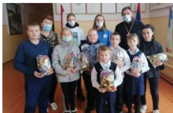
Рождественские подарки от Ардатовской епархии.

Колядование – древний обычай, свойственный, в основном, славянским народам, в ходе которого группы колядующих (обычно это были молодые люди) рядились различными животными, ходили по дворам, пели определенные (ритуальные) песни, короче говоря, отдыхали и веселились. Но во всем этом веселье был свой сакральный смысл — призыв благополучия, плодородия и прочего позитива и благ. Колядующие «дарили» крестьянскому дому благополучие на весь год, а хозяева отдаривали их козульками (рождественским печеньем), а также пирогами, ватрушками, пивом, деньгами.