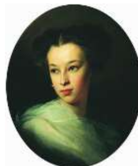
Портрет младшей дочери Пушкина Натальи.