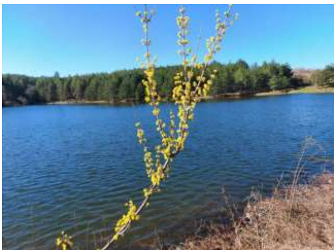
Веточка цветущего кизила.