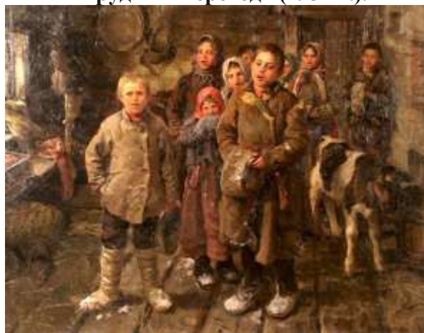
«Христославы» (1935 г.)

В 1970 году в Кочелаеве был открыт дом-музей выдающегося живописца.