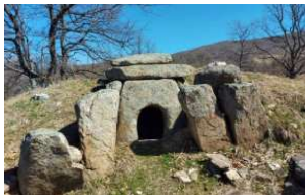
Царский дольмен около с. Хлябово.

Дольмены сделаны из черного слюдястого мрамора. В них хоронили известных личностей вместе с дарами и украшениями две тысячи лет до нашей эры, во времена фракийцев. Название происходит от внешнего вида обычных для Европы конструкций — приподнятой на каменных опорах плиты, напоминающей стол.