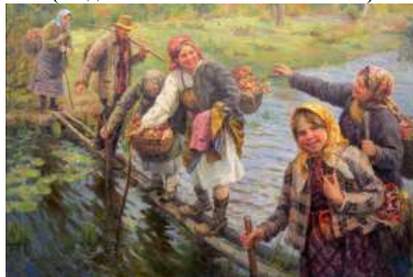
«Трудный переход» (1934 г.).