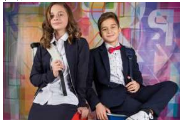
Разные варианты стильной школьной формы.

Вот и получается, что каждый ученик ходить должен в школьной форме. К тому же форма дисциплинирует, готовит к соблюдению дресс-кодов в будущей профессиональной жизни, исключает условия возникновения зависти относительно одежды.