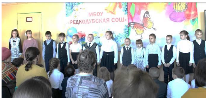
Учащиеся 1-5 классов в стихах выражают свою любовь к своим мамам.

задорными танцами, а также разными сюрпризами. Например, ведущие предложили мамам узнать себя на стенде с портретами, которые нарисовали их дети. Все гости приятно удивлены, когда увидели выступление хора и мини-спектакль в исполнении учащихся начальных классов.