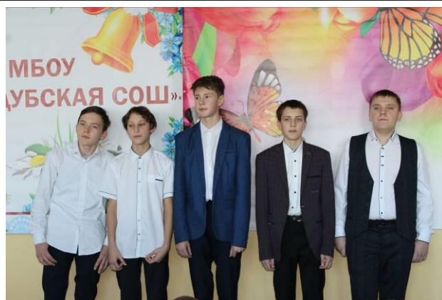
«И снова седая ночь...». Исполняют мальчики 7-9 классов.