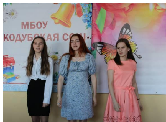
«Ясный мой свет...». Исполняют девятиклассницы.