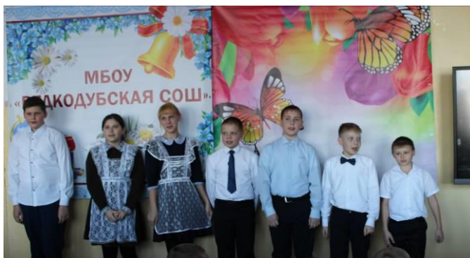
«Музыка нас связала...». Лётся песня в исполнении шестиклассников.