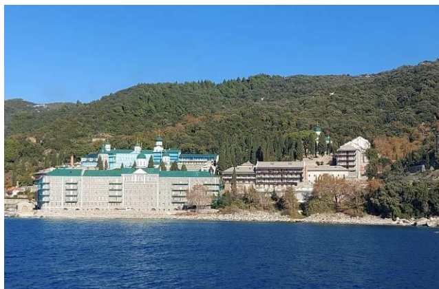
Русский монастырь Святого Пантелеймона.

За неделю мы посетили несколько греческих монастырей и один наш, русский. Всего на Афоне расположено 20 монастырей- 17 греческих, один русский, а также сербский и болгарский. До них можно добраться пешком или же на пароме. Русский удивил нас масштабностью, красотой и глубиной веры.