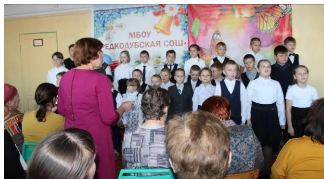
В исполнении хора прозвучали песни «Пусть всегда будет солнце» и «Край родной, навек любимый...».